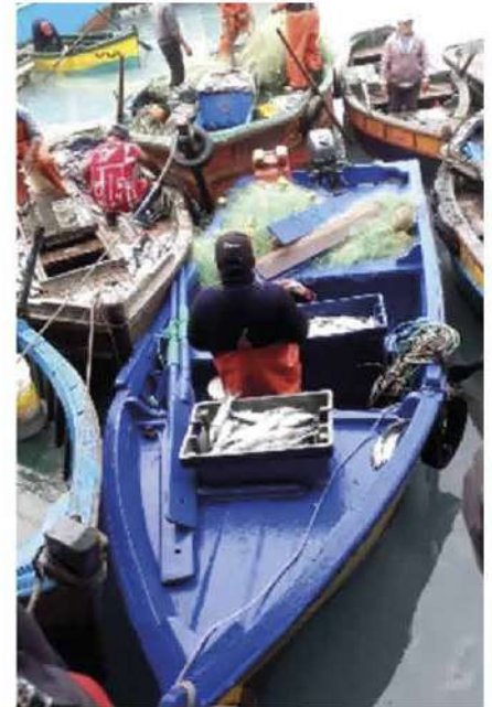
Código: RF/ODCAL/2022-04 Fecha: 03/02/2022 Lugar: DPA Callao Descripción: Descarga de recursos hidrobiológicos.