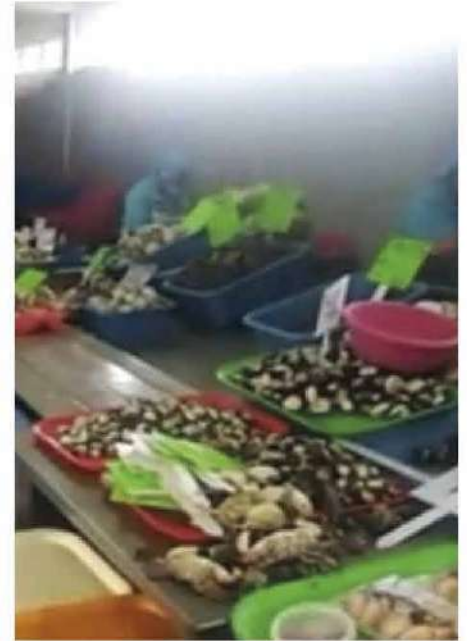
Código: RF/ODCAL/2022-03 Fecha: 03/02/2022 Lugar: FELMO SRLtda Descripción: Exhibición de mariscos.