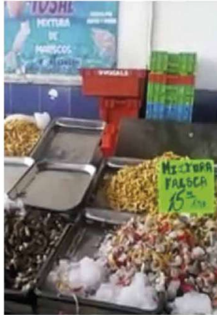
Código: RF/ODCAL/2022-02 Fecha: 03/02/2022 Lugar: FELMO SRLtda Descripción: Exhibición de mariscos.