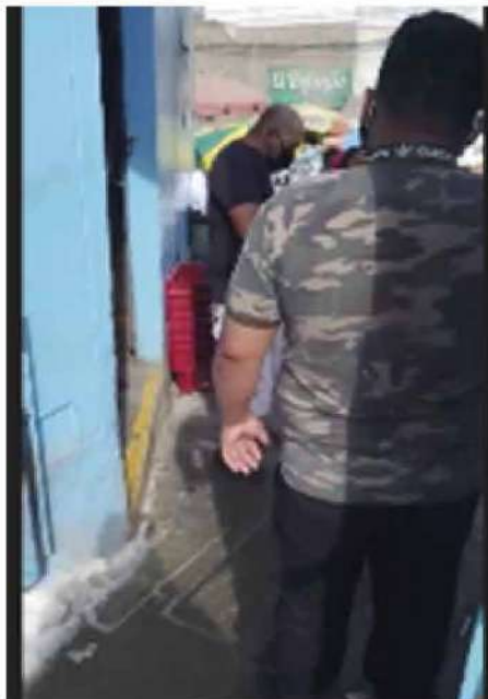
Código: RF/ODCAL/2022-01 Fecha: 03/02/2022 Lugar: SERINPES SA Descripción: Medidas de bioseguridad al ingreso.