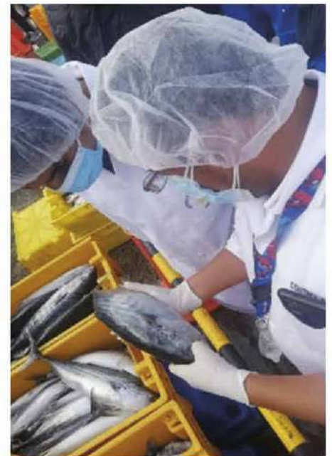
Código: RF/ODCAL/2022-06 Fecha: 03/02/2022 Lugar: FELMO SRLtda Descripción: Evaluación Sensorial a recursos hidrobiológicos.