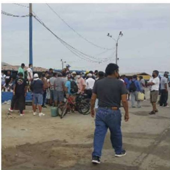
Código: RF/ODCAL/2022-01 Fecha: 03/02/2022 Lugar: MOLO MUELLE ANCÓN Descripción: Empadronamiento de pescadores y personal del muelle para limpieza de la Bahía Ancón.