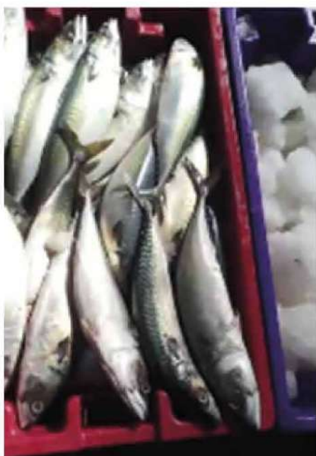
Código: RF/ODCAL/2022-04 Fecha: 03/02/2022 Lugar: SERINPES SA Descripción: Exhibición de pescados con hielo