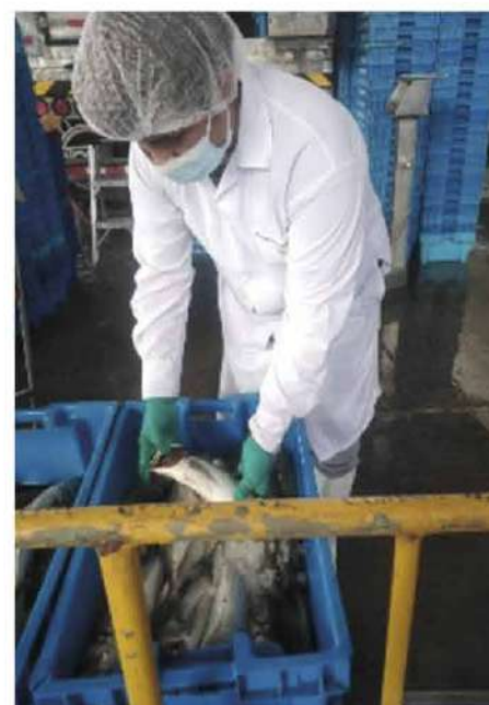
Código: RF/ODCAL/2022-06 Fecha: 03/02/2022 Lugar: SERINPES SA Descripción: Evaluación sensorial.