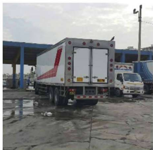
Código: RF/ODCAL/2022-02 Fecha: 03/02/2022 Lugar: MOLO MUELLE ANCÓN Descripción: Vehículos isotérmicos a la espera de carga de recursos hidrobiológicos.