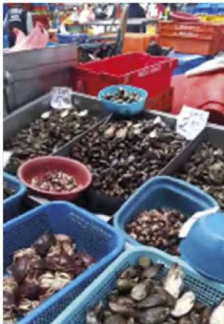
Código: RF/ODCAL/2022-02 Fecha: 03/02/2022 Lugar: SERINPES SA Descripción: Exhibición de mariscos.