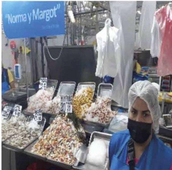
Código: RF/ODCAL/2022-01 Fecha: 03/02/2022 Lugar: MULTIMERCADOS ZONALES SA – MI PESCA Descripción: Comercialización de recursos hidrobiológicos.