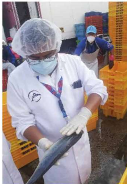
Código: RF/ODCAL/2022-05 Fecha: 03/02/2022 Lugar: FELMO SRLtda Descripción: Evaluación Sensorial a recursos hidrobiológicos.