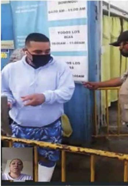
Código: RF/ODCAL/2022-01 Fecha: 03/02/2022 Lugar: FELMO SRLtda Descripción: Medidas de bioseguridad al ingreso.