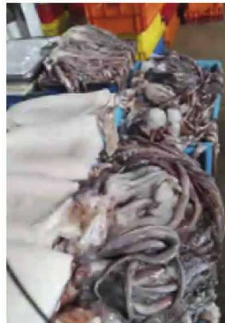
Código: RF/ODCAL/2022-03 Fecha: 03/02/2022 Lugar: SERINPES SA Descripción: Comercialización de recursos hidrobiológicos.