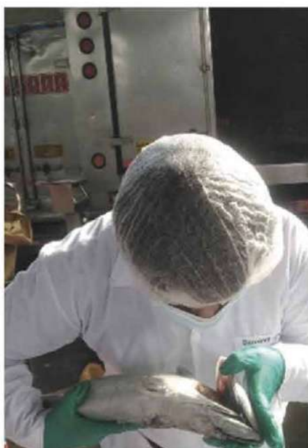
Código: RF/ODCAL/2022-05 Fecha: 03/02/2022 Lugar: SERINPES SA Descripción: Evaluación sensorial.