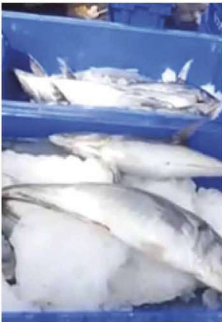
Código: RF/ODCAL/2022-04 Fecha: 03/02/2022 Lugar: FELMO SRLtda Descripción: Exhibición de pescado con hielo.