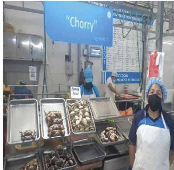
Código: RF/ODCAL/2022-02 Fecha: 03/02/2022 Lugar: MULTIMERCADOS ZONALES SA – MI PESCA Descripción: Exhibición de mariscos.