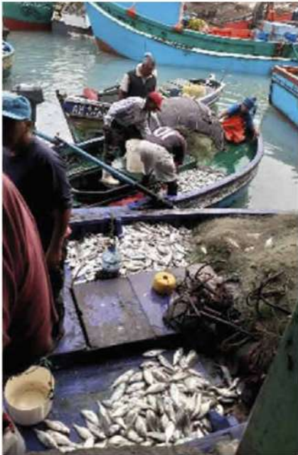
Código: RF/ODCAL/2022-03 Fecha: 03/02/2022 Lugar: DPA Callao Descripción: Descarga de recursos hidrobiológicos.