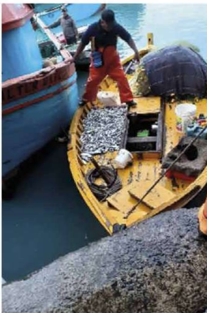
Código: RF/ODCAL/2022-01 Fecha: 03/02/2022 Lugar: DPA Callao Descripción: Descarga de recursos hidrobiológicos.