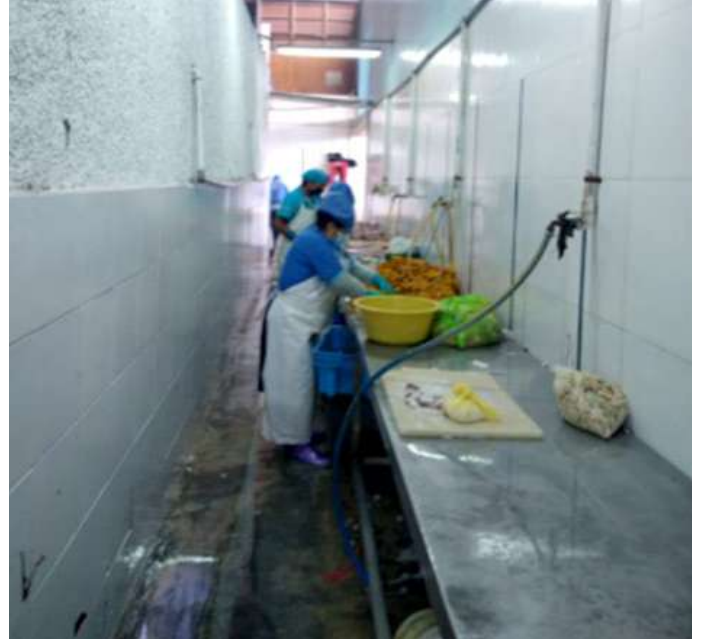
Código: RF/ODCAL/2022-02 Fecha: 12/02/2022 Lugar: FELMO SRLtda Descripción: Personal con indumentaria completa.