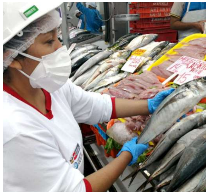
Código: RF/ODCAL/2022-04 Fecha: 12/02/2022 Lugar: MULTIMERCADOS ZONALES SA Descripción: Análisis sensorial de recursos hidrobiológicos.