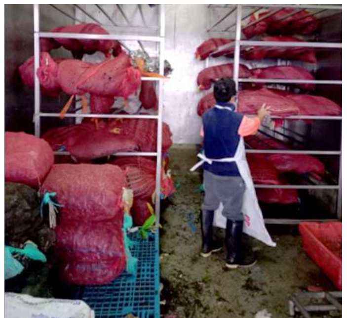
Código: RF/ODCAL/2022-04 Fecha: 12/02/2022 Lugar: SERINPES SA Descripción: Cámara de refrigeración almacena moluscos bivalvos.