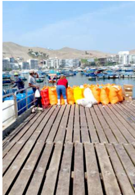
Código: RF/ODCAL/2022-02 Fecha: 12/02/2022 Lugar: MOLO MUELLE ANCÓN Descripción: Abastecimiento de hielo a E/P.