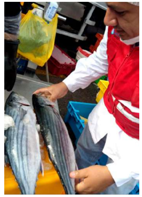
Código: RF/ODCAL/2022-04 Fecha: 12/02/2022 Lugar: FELMO SRLtda Descripción: Análisis sensorial a recursos hidrobiológicos.