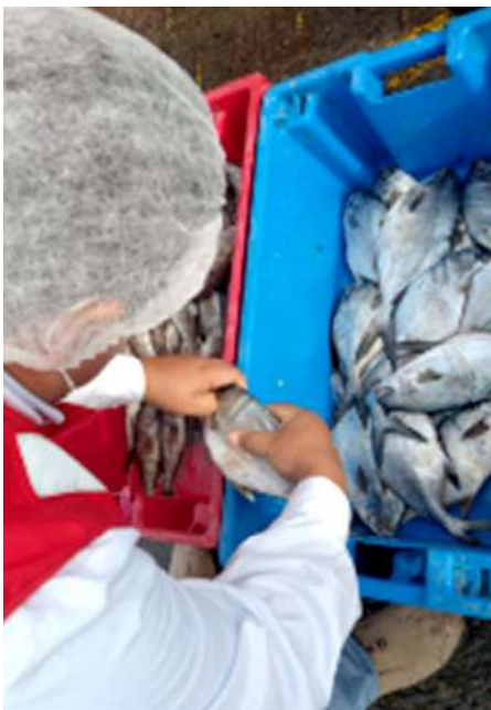
Código: RF/ODCAL/2022-03 Fecha: 12/02/2022 Lugar: FELMO SRLtda Descripción: Análisis sensorial a pescados.