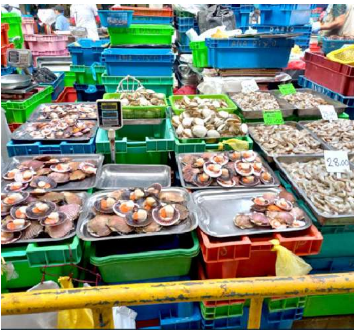
Código: RF/ODCAL/2022-03 Fecha: 12/02/2022 Lugar: SERINPES SA Descripción: Exhibición de recursos hidrobiológicos con hielo.