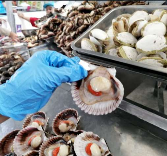
Código: RF/ODCAL/2022-01 Fecha: 12/02/2022 Lugar: MULTIMERCADOS ZONALES SA Descripción: Análisis sensorial de recursos hidrobiológicos.