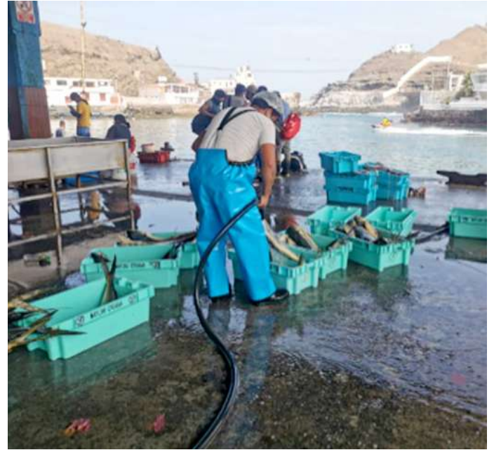
Código: RF/ODCAL/2022-02 Fecha: 12/02/2022 Lugar: DPA PUCUSANA Descripción: Lavado de recurso perico.