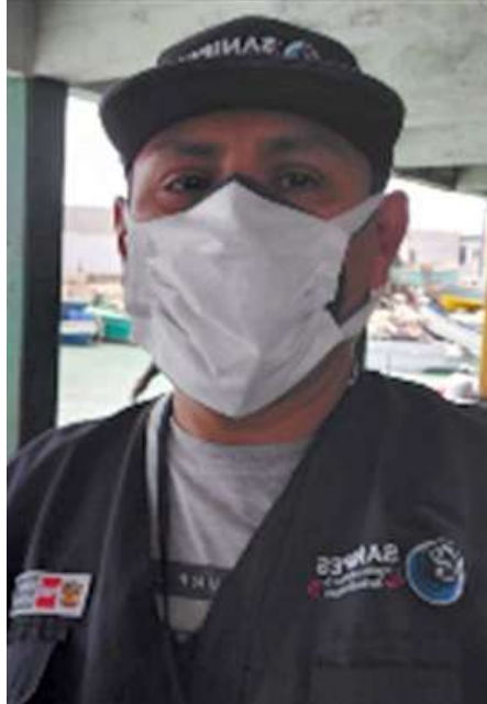
Código: RF/ODCAL/2022-02 Fecha: 12/02/2022 Lugar: DPA Callao. Descripción: Sin actividad de descarga de recursos hidrobiológicos.