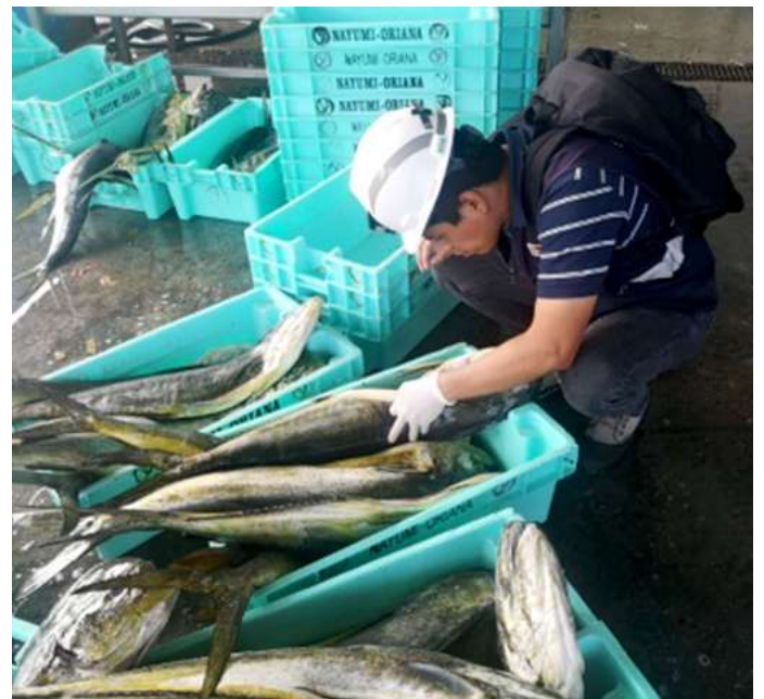
Código: RF/ODCAL/2022-04 Fecha: 12/02/2022 Lugar: DPA PUCUSANA Descripción: Análisis sensorial al recurso perico.