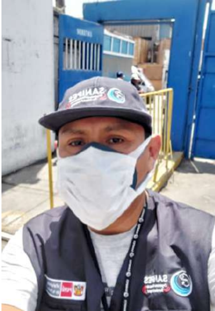
Código: RF/ODCAL/2022-01 Fecha: 12/02/2022 Lugar: DPA Callao Descripción: DPA Callao.