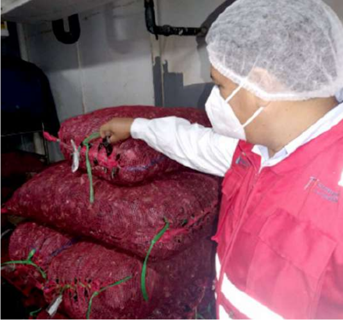
Código: RF/ODCAL/2022-01 Fecha: 12/02/2022 Lugar: FELMO SRLtda Descripción: Almacenamiento de moluscos bivalvos rastreables dentro de la cámara de almacenamiento de productos frescos – refrigerados.