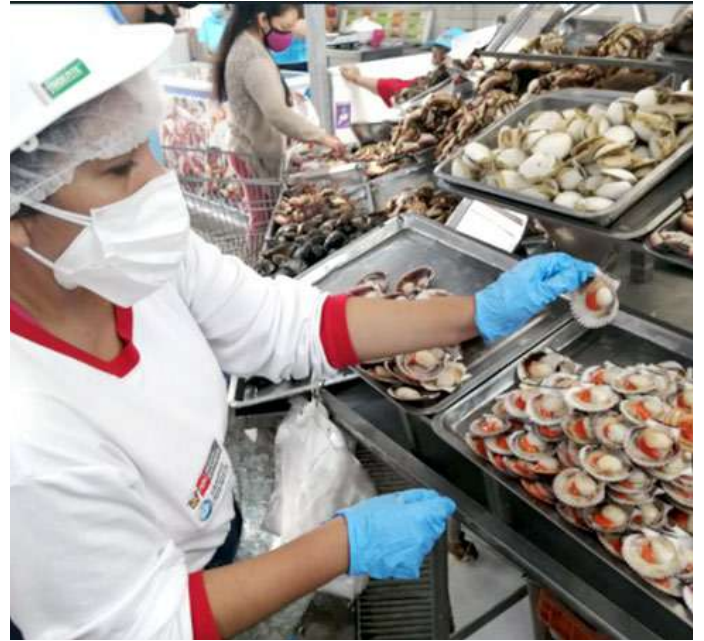
Código: RF/ODCAL/2022-02 Fecha: 12/02/2022 Lugar: MULTIMERCADOS ZONALES SA Descripción: Análisis sensorial de recursos hidrobiológicos.