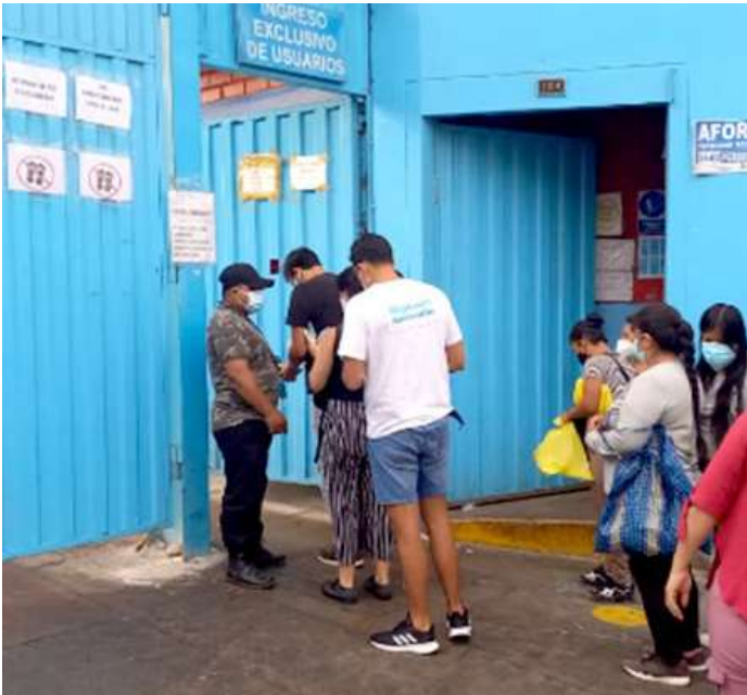
Código: RF/ODCAL/2022-01 Fecha: 12/02/2022 Lugar: SERINPES SA Descripción: Medidas de bioseguridad al ingreso del establecimiento.