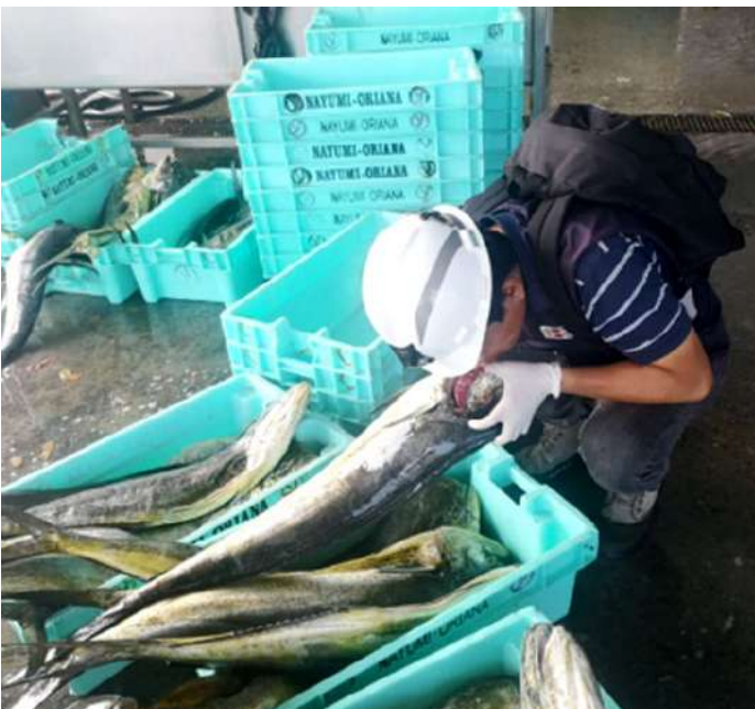
Código: RF/ODCAL/2022-03 Fecha: 12/02/2022 Lugar: DPA PUCUSANA Descripción: Análisis sensorial al recurso perico.