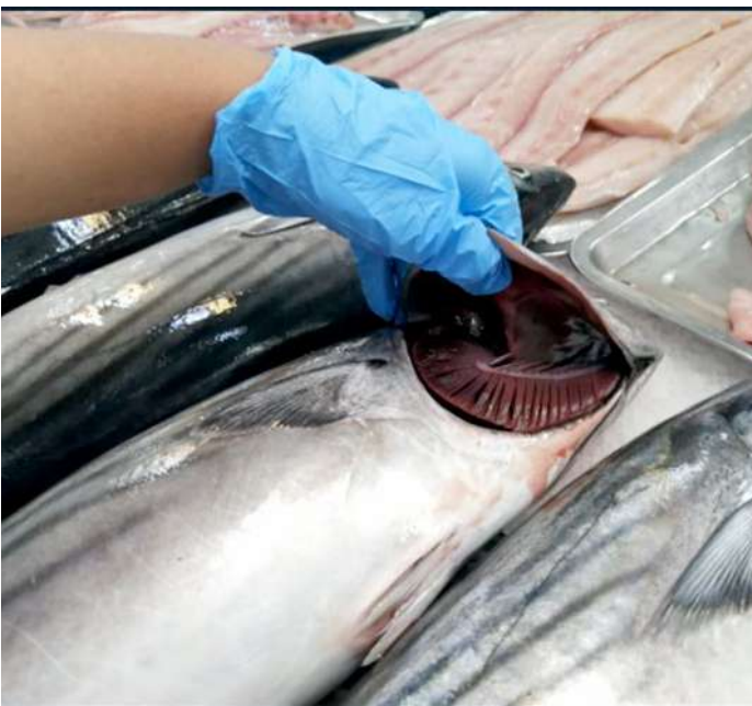
Código: RF/ODCAL/2022-03 Fecha: 12/02/2022 Lugar: MULTIMERCADOS ZONALES SA Descripción: Análisis sensorial de recursos hidrobiológicos.