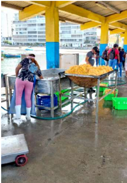
Código: RF/ODCAL/2022-01 Fecha: 12/02/2022 Lugar: MOLO MUELLE ANCÓN Descripción: Lavado de huevera.