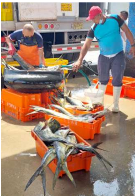
Código: RF/ODCAL/2022-04 Fecha: 12/02/2022 Lugar: MOLO MUELLE ANCÓN Descripción: Descarga de recursos hidrobiológicos (perico).