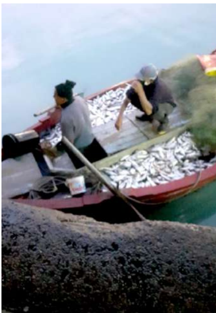
Código: RF/ODCAL/2022-03 Fecha: 12/02/2022 Lugar: DPA Callao Descripción: Descarga de pesca de cortina.