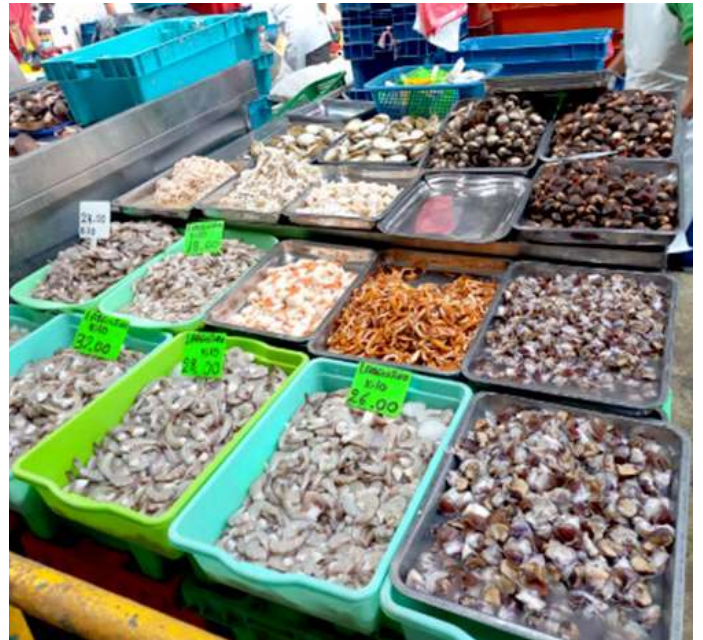
Código: RF/ODCAL/2022-02 Fecha: 12/02/2022 Lugar: SERINPES SA Descripción: Exhibición de recursos hidrobiológicos con hielo.