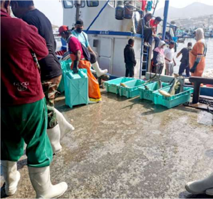
Código: RF/ODCAL/2022-01 Fecha: 12/02/2022 Lugar: DPA PUCUSANA Descripción: Descarga de perico.