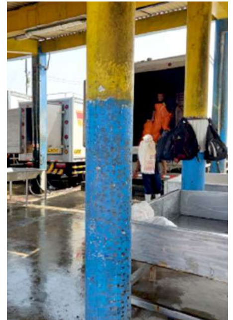
Código: RF/ODCAL/2022-03 Fecha: 12/02/2022 Lugar: MOLO MUELLE ANCÓN Descripción: Vehículos isotérmicos a la espera de la carga de recursos hidrobiológicos.