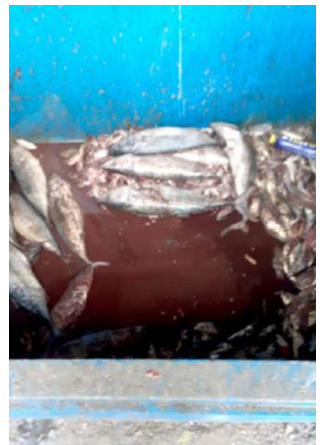
Código: RF/ODCAL/2022-04 Fecha: 12/02/2022 Lugar: DPA Callao Descripción: Recurso en área de tareas previas.