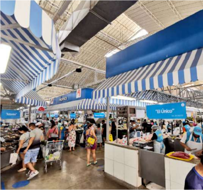
Código: RF/ODCAL/2022-01 Fecha: 13/02/2022 Lugar: MULTIMERCADOS ZONALES SA Descripción: Actividades de comercialización de recursos hidrobiológicos.