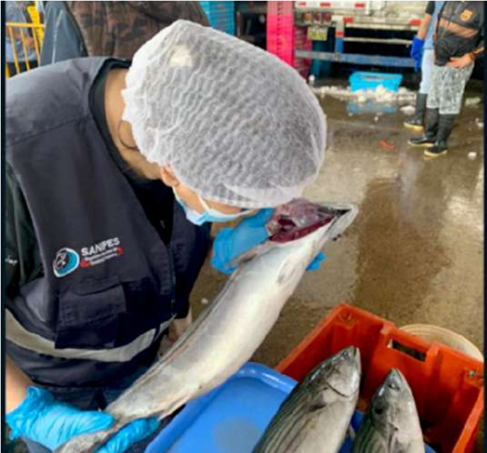
Código: RF/ODCAL/2022-03 Fecha: 13/02/2022 Lugar: SERINPES SA Descripción: Análisis sensorial a recursos hidrobiológicos.