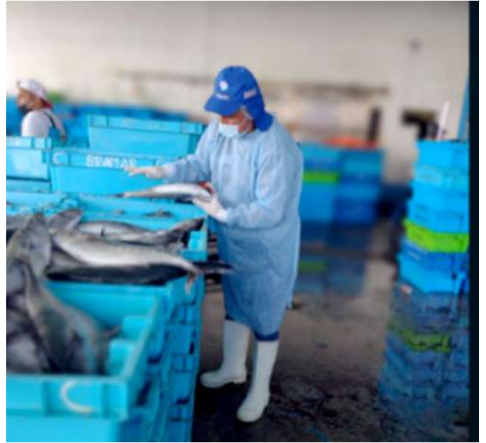
Código: RF/ODCAL/2022-03 Fecha: 13/02/2022 Lugar: DPA Pucusana Descripción: Análisis sensorial de recursos hidrobiológicos.