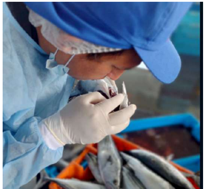
Código: RF/ODCAL/2022-06 Fecha: 13/02/2022 Lugar: DPA PUCUSANA Descripción: Análisis sensorial al recurso bonito.