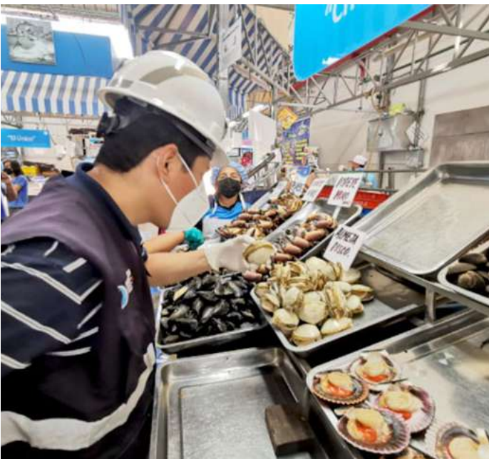
Código: RF/ODCAL/2022-03 Fecha: 13/02/2022 Lugar: MULTIMERCADOS ZONALES SA Descripción: Análisis sensorial a mariscos.