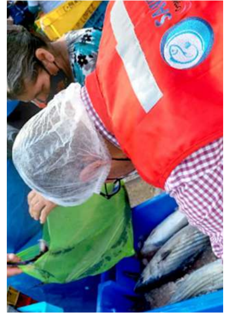
Código: RF/ODCAL/2022-04 Fecha: 13/02/2022 Lugar: FELMO SRLtda Descripción: Análisis sensorial a recursos hidrobiológicos.