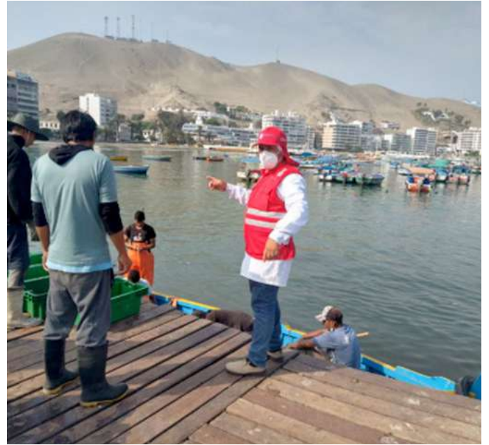
Código: RF/ODCAL/2022-02 Fecha: 13/02/2022 Lugar: MOLO MUELLE ANCÓN Descripción: Descarga de perico.