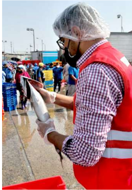
Código: RF/ODCAL/2022-03 Fecha: 13/02/2022 Lugar: FELMO SRLtda Descripción: Análisis sensorial a pescados.