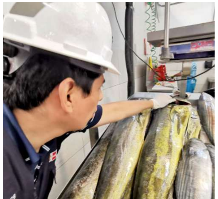
Código: RF/ODCAL/2022-04 Fecha: 13/02/2022 Lugar: MULTIMERCADOS ZONALES SA Descripción: Análisis sensorial a pescados.