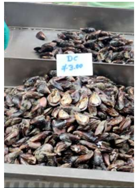
Código: RF/ODCAL/2022-02 Fecha: 13/02/2022 Lugar: SERINPES SA Descripción: Exhibición de mariscos remanentes rastreados.