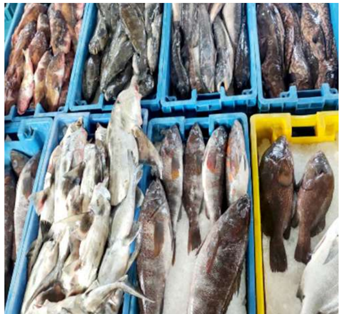
Código: RF/ODCAL/2022-06 Fecha: 13/02/2022 Lugar: SERINPES SA Descripción: Recursos hidrobiológicos mantenidos con hielo.