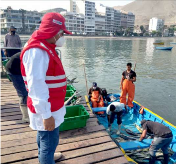
Código: RF/ODCAL/2022-01 Fecha: 13/02/2022 Lugar: MOLO MUELLE ANCÓN Descripción: Descarga de perico.