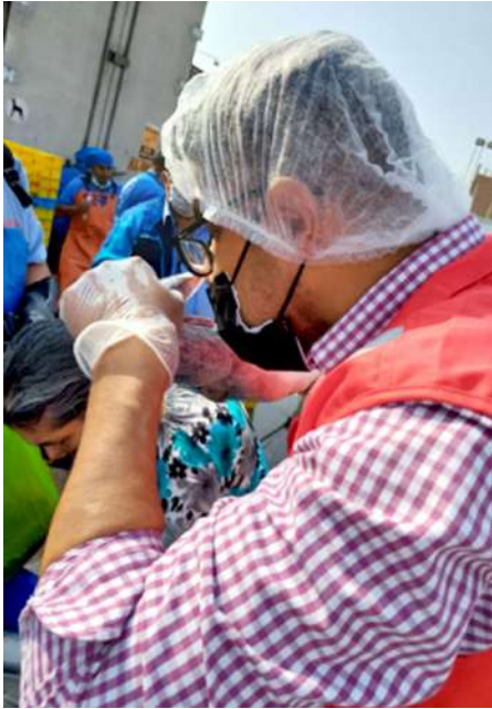
Código: RF/ODCAL/2022-02 Fecha: 13/02/2022 Lugar: FELMO SRLtda Descripción: Personal con indumentaria completa.