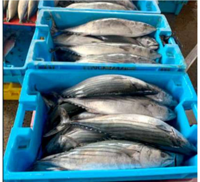
Código: RF/ODCAL/2022-04 Fecha: 13/02/2022 Lugar: SERINPES SA Descripción: Recursos hidrobiológicos, almacenados en cajas sanitarias plásticas con buen estado de mantenimiento y limpieza.