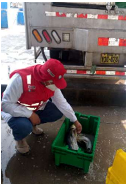
Código: RF/ODCAL/2022-03 Fecha: 13/02/2022 Lugar: MOLO MUELLE ANCÓN Descripción: Análisis sensorial a recurso perico