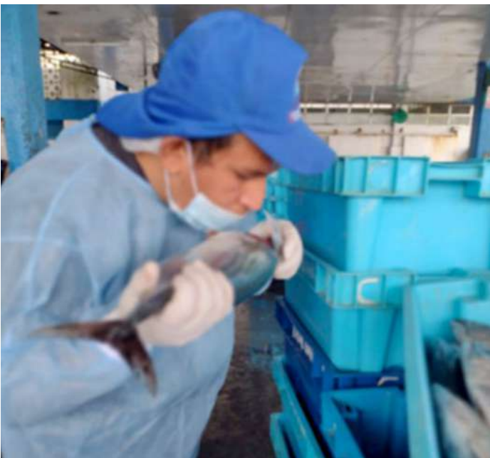
Código: RF/ODCAL/2022-05 Fecha: 13/02/2022 Lugar: DPA PUCUSANA Descripción: Análisis sensorial al recurso bonito.