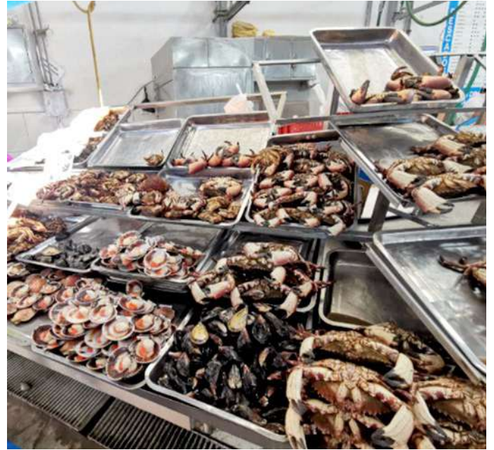
Código: RF/ODCAL/2022-02 Fecha: 13/02/2022 Lugar: MULTIMERCADOS ZONALES SA Descripción: Exhibición de mariscos remanentes.