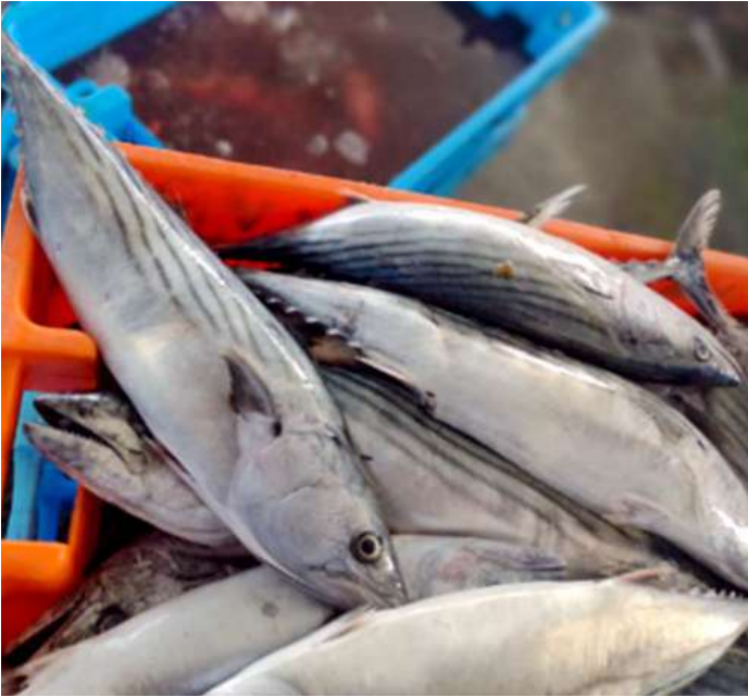
Código: RF/ODCAL/2022-02 Fecha: 13/02/2022 Lugar: DPA Pucusana Descripción: Recurso bonito, almacenado en cajas sanitarias plásticas.