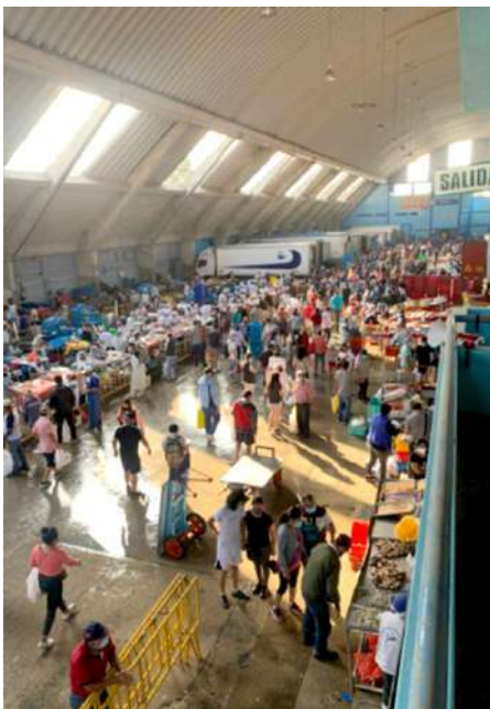
Código: RF/ODCAL/2022-01 Fecha: 13/02/2022 Lugar: SERINPES SA Descripción: Labores de comercialización del terminal pesquero.