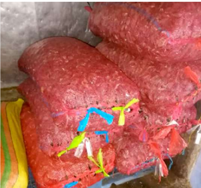
Código: RF/ODCAL/2022-05 Fecha: 13/02/2022 Lugar: SERINPES SA Descripción: Recurso choro almacenado en cámara de refrigeración.