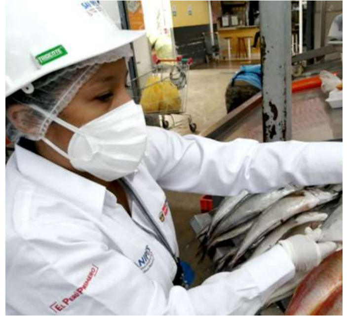
Código: RF/ODCAL/2022-02 Fecha: 15/02/2022 Lugar: MULTIMERCADOS ZONALES SA Descripción: Análisis sensorial a recursos hidrobiológicos.