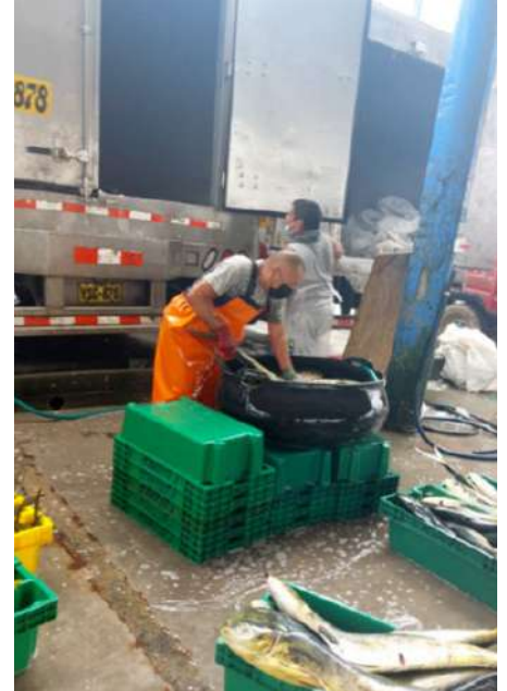
Código: RF/ODCAL/2022-01 Fecha: 15/02/2022 Lugar: MOLO MUELLE ANCÓN Descripción: Descarga y lavado del recurso perico.