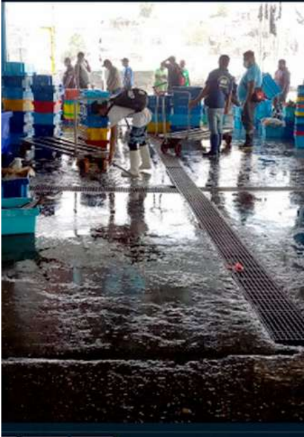
Código: RF/ODCAL/2022-01 Fecha: 15/02/2022 Lugar: DPA Pucusana Descripción: Desembarque de recursos hidrobiológicos.