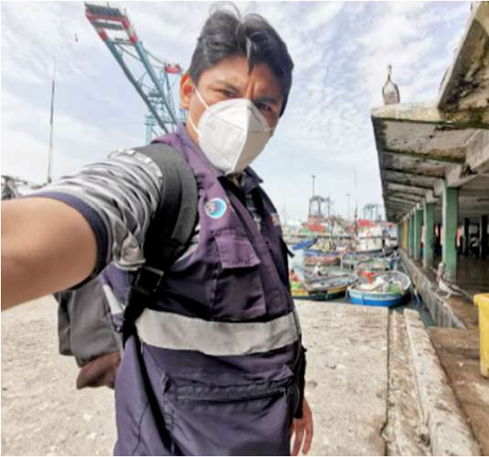
Código: RF/ODCAL/2022-01 Fecha: 15/02/2022 Lugar: DPA Callao Descripción: DPA sin actividades de descarga de recursos hidrobiológicos.