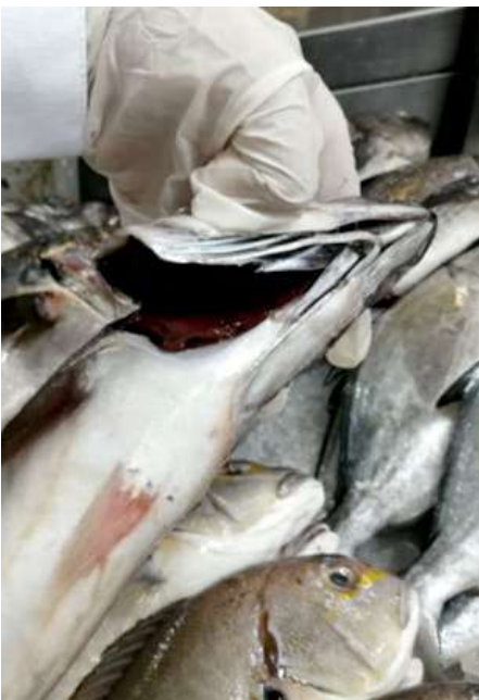
Código: RF/ODCAL/2022-03 Fecha: 15/02/2022 Lugar: MULTIMERCADOS ZONALES SA Descripción: Análisis sensorial a recursos hidrobiológicos.