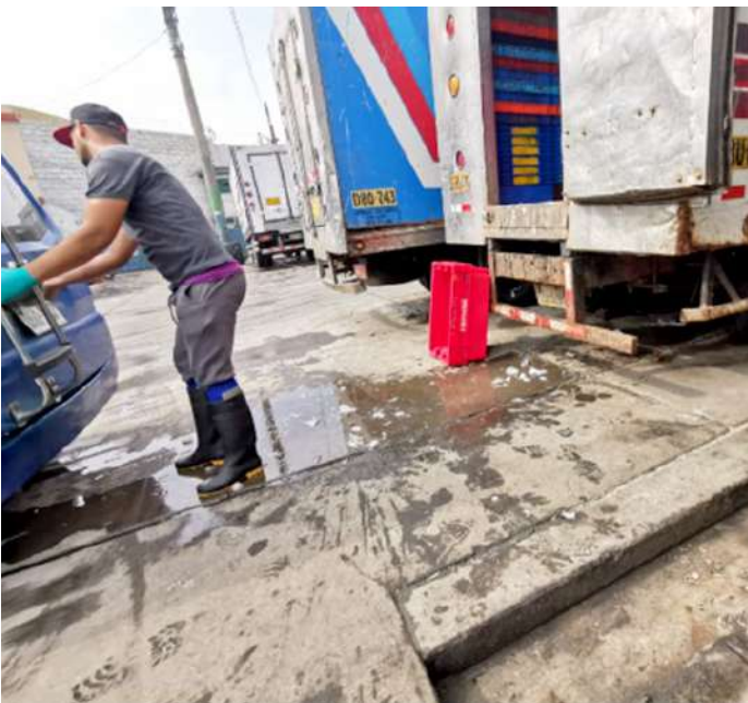
Código: RF/ODCAL/2022-03 Fecha: 15/02/2022 Lugar: DPA Callao Descripción: DPA sin actividades de descarga de recursos hidrobiológicos.