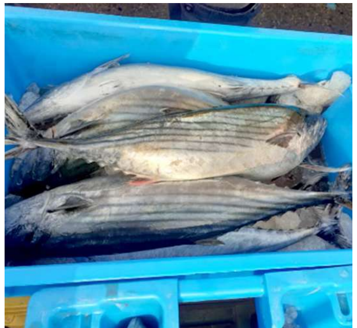
Código: RF/ODCAL/2022-04 Fecha: 15/02/2022 Lugar: FELMO SRLtda Descripción: Análisis sensorial a recursos hidrobiológicos.