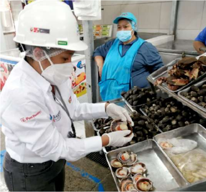
Código: RF/ODCAL/2022-01 Fecha: 15/02/2022 Lugar: MULTIMERCADOS ZONALES SA Descripción: Análisis sensorial a recursos hidrobiológicos.