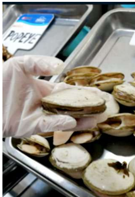
Código: RF/ODCAL/2022-04 Fecha: 15/02/2022 Lugar: MULTIMERCADOS ZONALES SA Descripción: Análisis sensorial a mariscos.