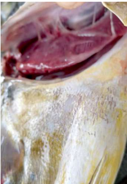
Código: RF/ODCAL/2022-03 Fecha: 15/02/2022 Lugar: DPA Pucusana Descripción: Análisis sensorial de recursos hidrobiológicos.