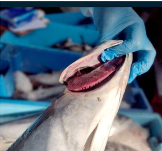
Código: RF/ODCAL/2022-03 Fecha: 15/02/2022 Lugar: SERINPES SA Descripción: Análisis sensorial a recursos hidrobiológicos.