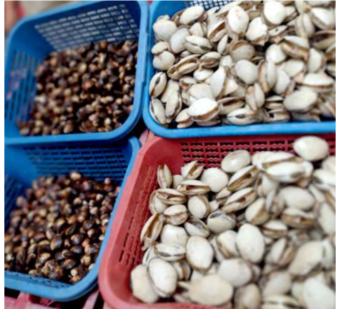
Código: RF/ODCAL/2022-02 Fecha: 15/02/2022 Lugar: SERINPES SA Descripción: Labores de comercialización de recursos hidrobiológicos en el terminal pesquero.