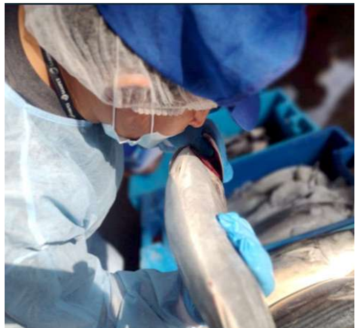
Código: RF/ODCAL/2022-04 Fecha: 15/02/2022 Lugar: SERINPES SA Descripción: Análisis sensorial a recursos hidrobiológicos.