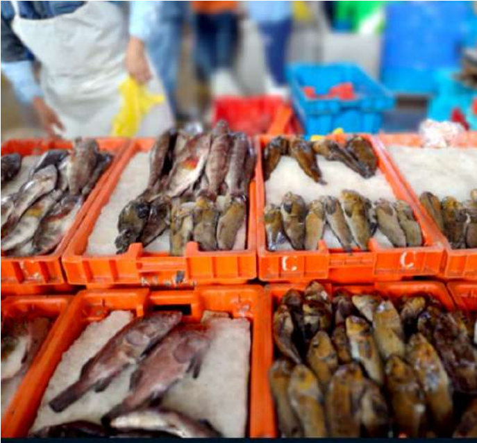
Código: RF/ODCAL/2022-01 Fecha: 15/02/2022 Lugar: SERINPES SA Descripción: Labores de comercialización de recursos hidrobiológicos en el terminal pesquero.