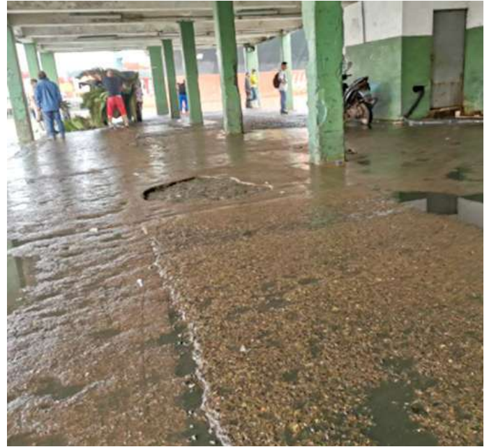
Código: RF/ODCAL/2022-02 Fecha: 15/02/2022 Lugar: DPA Callao Descripción: DPA sin actividades de descarga de recursos hidrobiológicos.