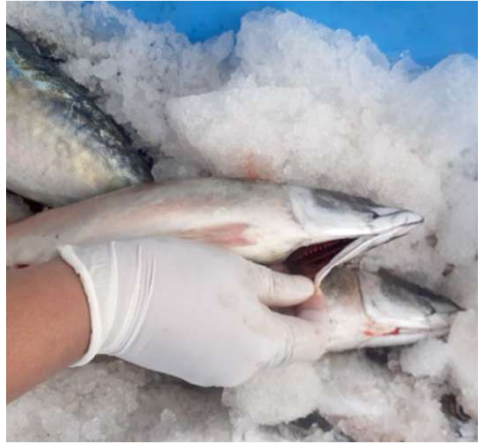
Código: RF/ODCAL/2022-02 Fecha: 15/02/2022 Lugar: FELMO SRLtda Descripción: Análisis sensorial a recursos hidrobiológicos.