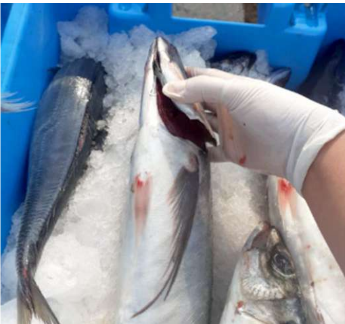
Código: RF/ODCAL/2022-03 Fecha: 15/02/2022 Lugar: FELMO SRLtda Descripción: Análisis sensorial a recursos hidrobiológicos.