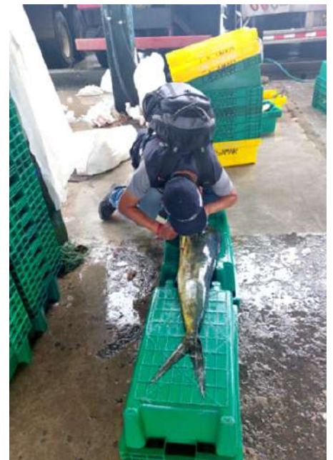
Código: RF/ODCAL/2022-02 Fecha: 15/02/2022 Lugar: MOLO MUELLE ANCÓN Descripción: Análisis sensorial al recurso perico.