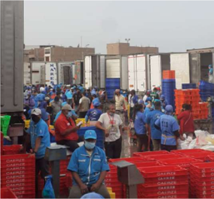
Código: RF/ODCAL/2022-01 Fecha: 15/02/2022 Lugar: FELMO SRLtda Descripción: Actividades de comercialización.