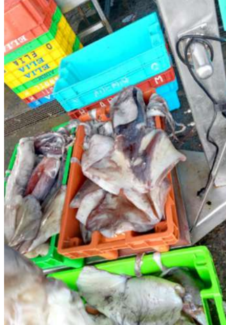
Código: RF/ODCAL/2022-02 Fecha: 15/02/2022 Lugar: DPA Pucusana Descripción: Análisis sensorial a recursos hidrobiológicos.