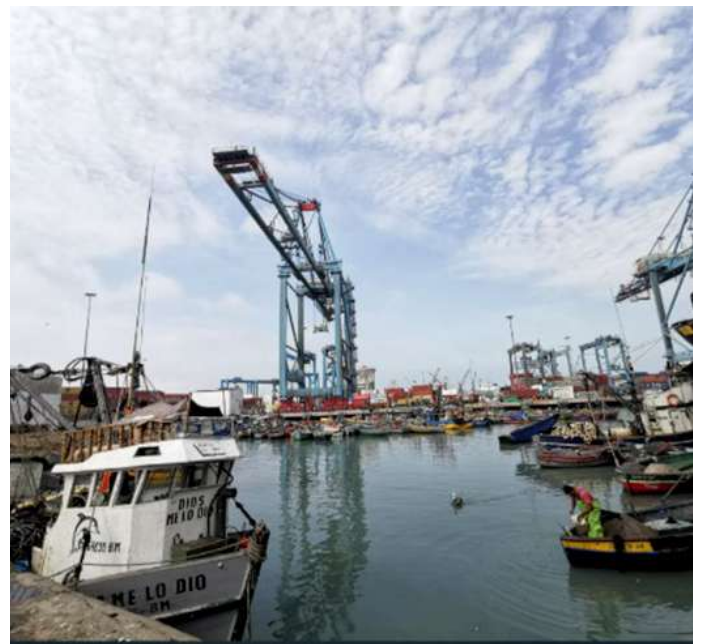
Código: RF/ODCAL/2022-04 Fecha: 15/02/2022 Lugar: DPA Callao Descripción: Bahía Callao.