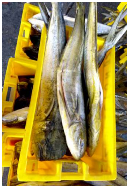
Código: RF/ODCAL/2022-04 Fecha: 15/02/2022 Lugar: DPA Pucusana Descripción: Análisis sensorial de recursos hidrobiológicos.