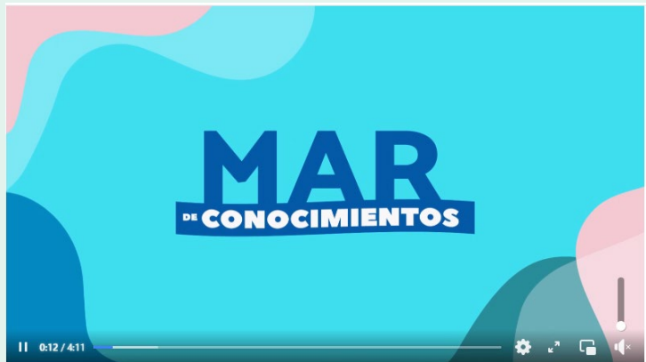
Inspecciones para Certificación Sanitaria de peces ornamentales