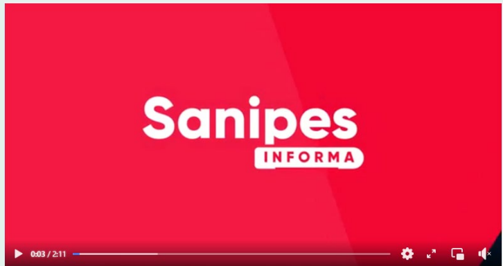
Edición de nuestro micronoticiero #SanipesInforma