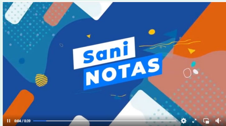
¿Qué es la Sala de Producción de Cepas, Lecturas e Identificación?