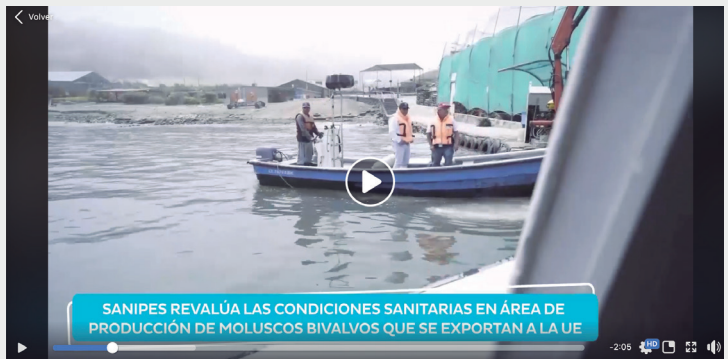
Laboratorios de ensayo - Sechura y Callao