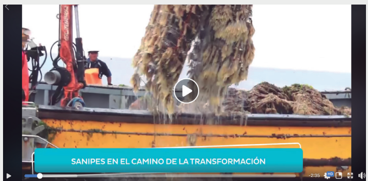
SANIPES INFORMA 29.01.2020