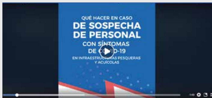
Sanipes a tu servicio