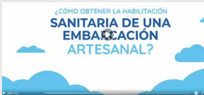
¿Quieres obtener la habilitación sanitaria para tu embarcación artesanal?