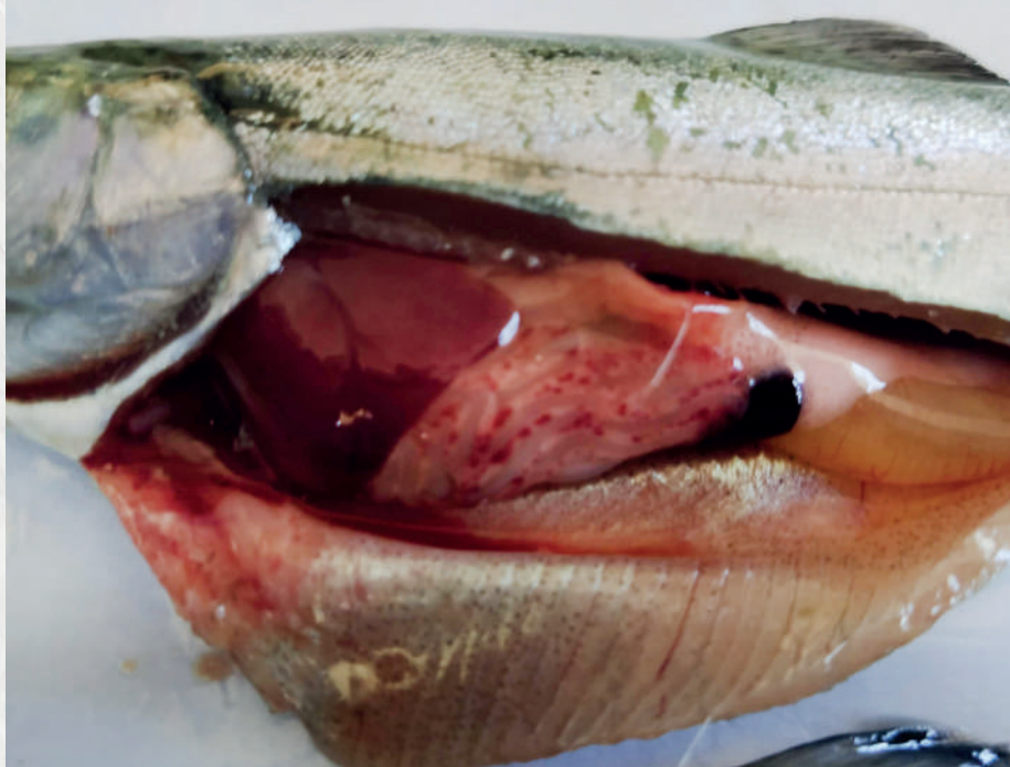
Hemorragias petequiales, principalmente en ciegos pilóricos - páncreas