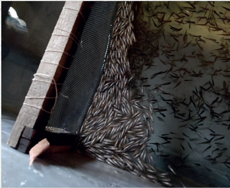
Mortalidades atípicas entre 10% a más del 90% del lote

¿Sabías que algunos de estos signos clínicos pueden presentarse en casos de VNPI ?