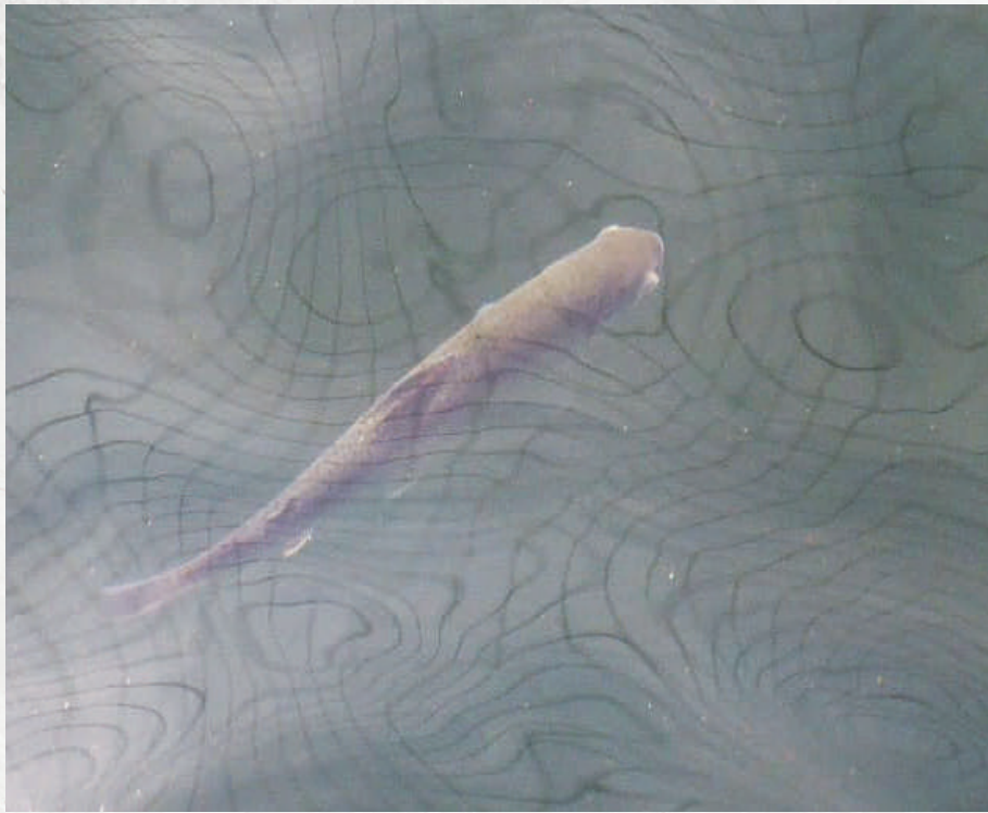
Letargia, nado rotativo en superficie (tirabuzón), pérdida de reflejo de huida