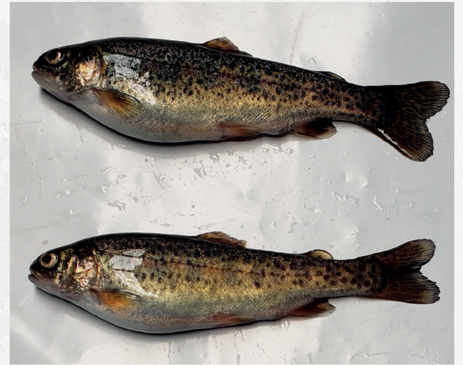
Ascitis (cavidad abdominal distendida)