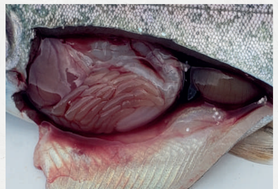
Líquido en cavidad abdominal (transparente, amarillo o sanguinolento)