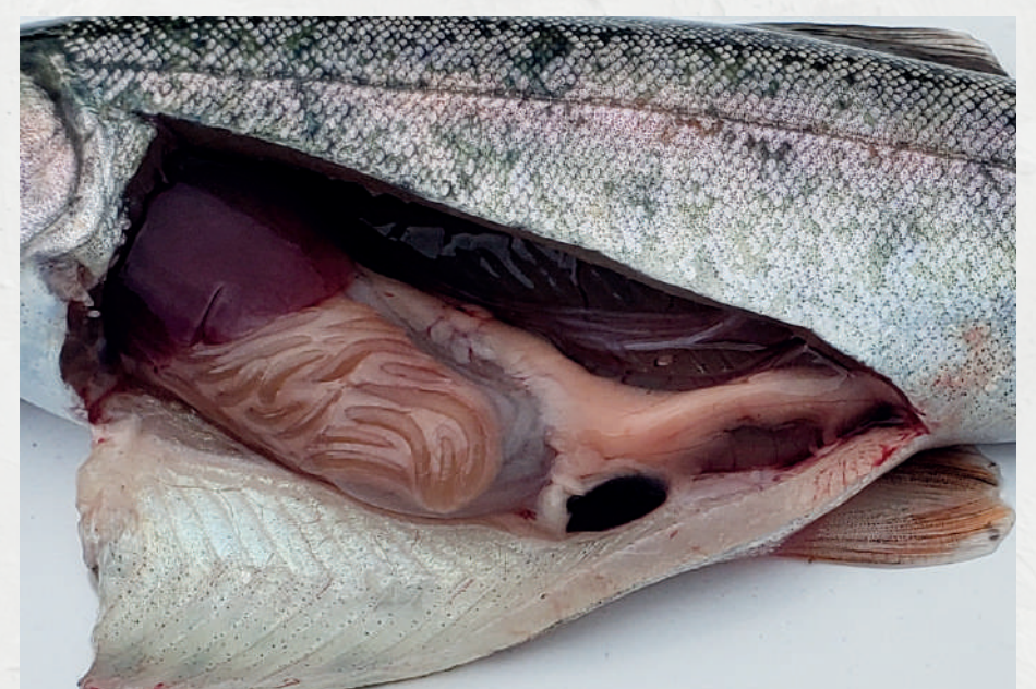
Esplenomegalia (agrandamiento del bazo)