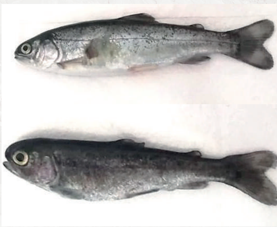
Melanosis (oscurecimiento de la piel)