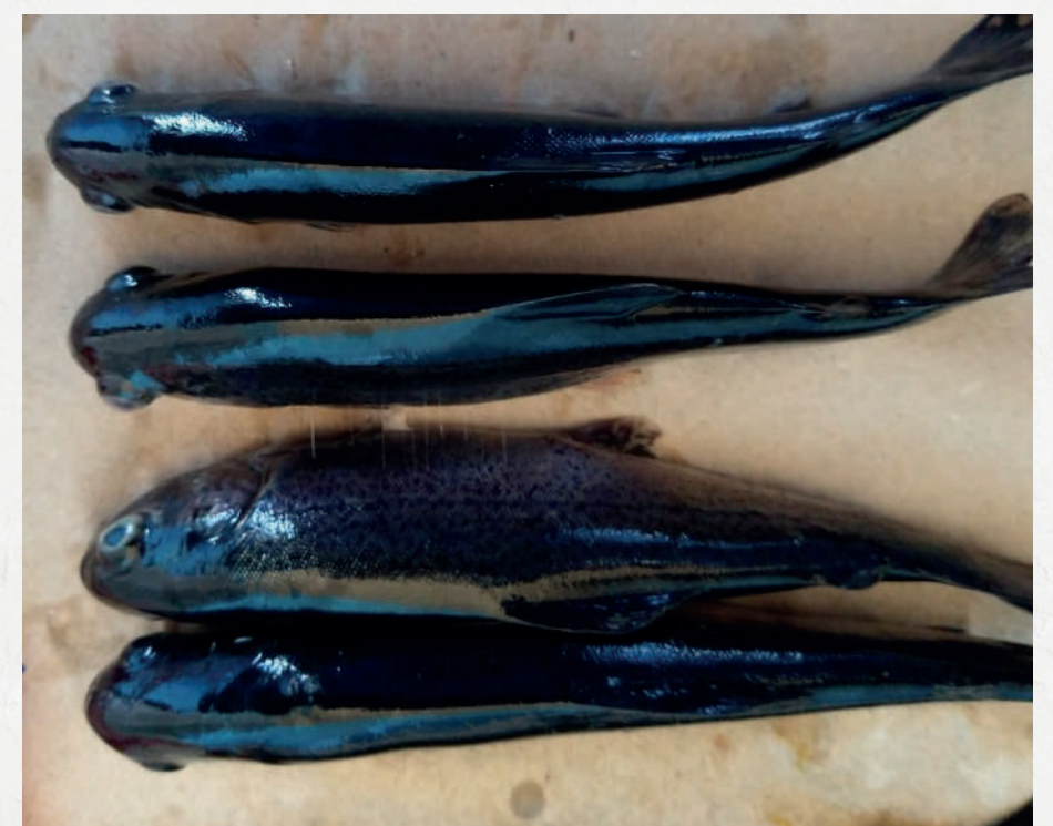
Exoftalmia (ojos saltones) y melanosis